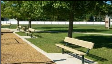
Parques / Espacio Abierto / Campo de Recreación