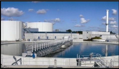
Infraestructura de Agua y Aguas Residuales