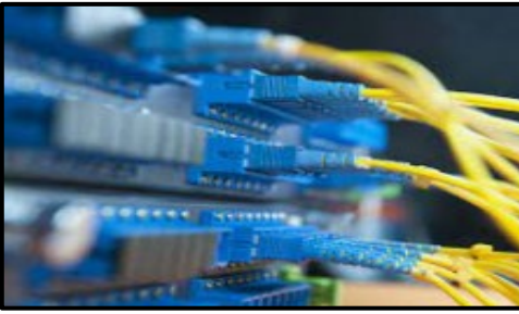
Banda Ancha / Fibra Óptica