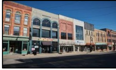
Empresas Pequeñas / Organizaciones sin Fines de Lucro