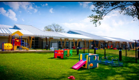
Guarderías Infantiles y Bibliotecas