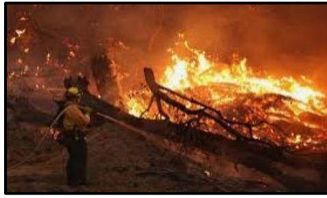
Prevención de Incendios Forestales / Otras Respuestas al Cambio Climático