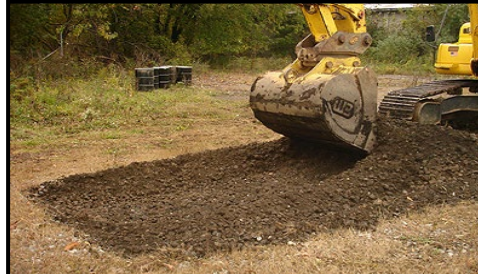
Remediación de Terrenos Abandonados