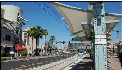
Calles / Estacionamiento / Transporte Público